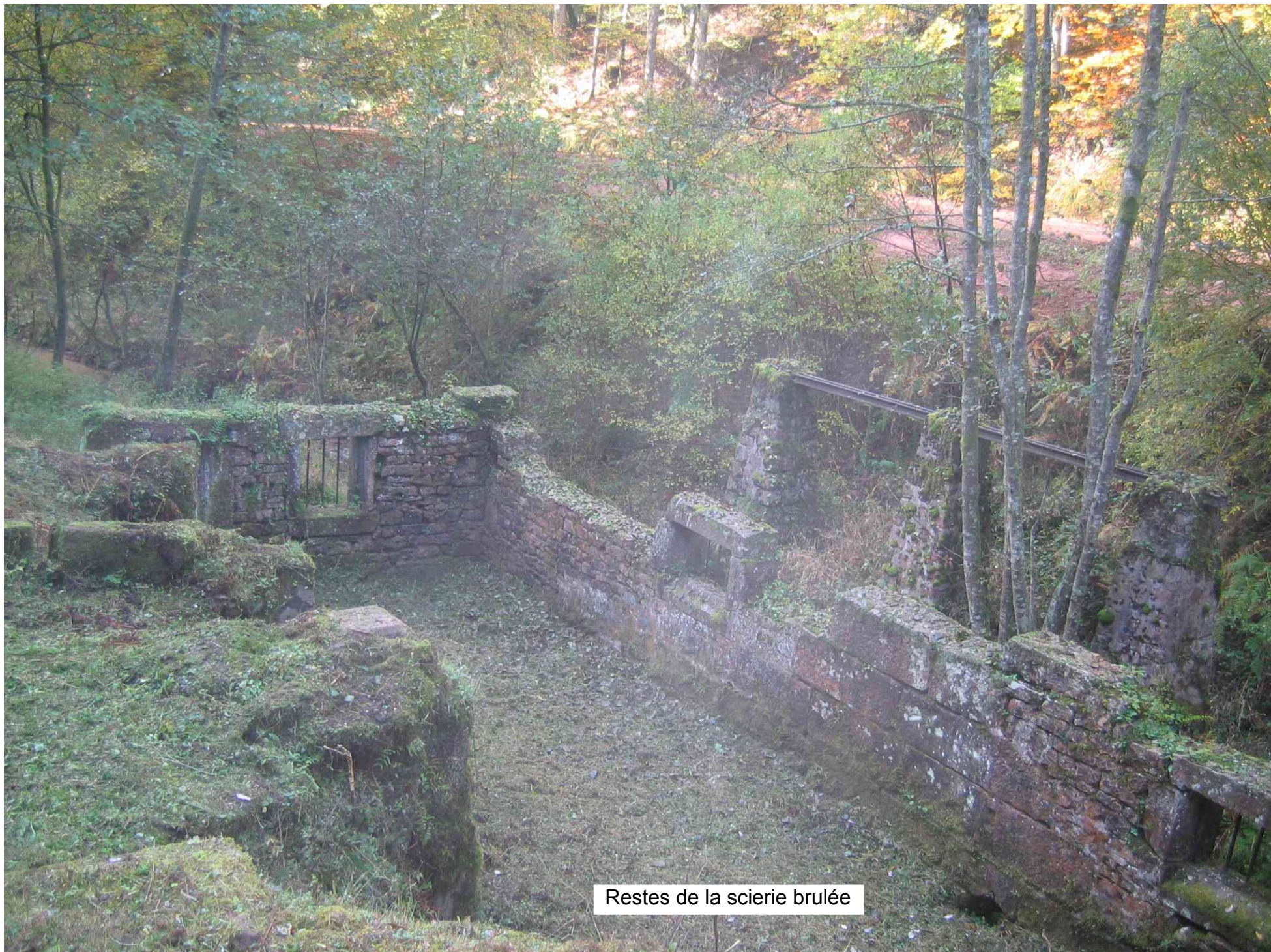
Restes de la scierie brûlée