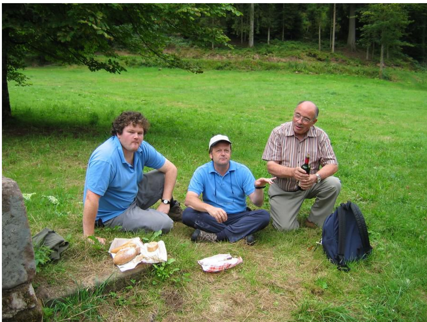
Une pause. Clairière de Coichot

Ici les 7 et 8 octobre 1944 : dernier point de rendez-vous des parachutistes de Loyton avant le retrait vers les lignes américaines, et incendie consécutif de la Maison Forestière et de la scierie par les EinsatzKommandos du Sipo/SD (voir photo d'époque ci dessous)