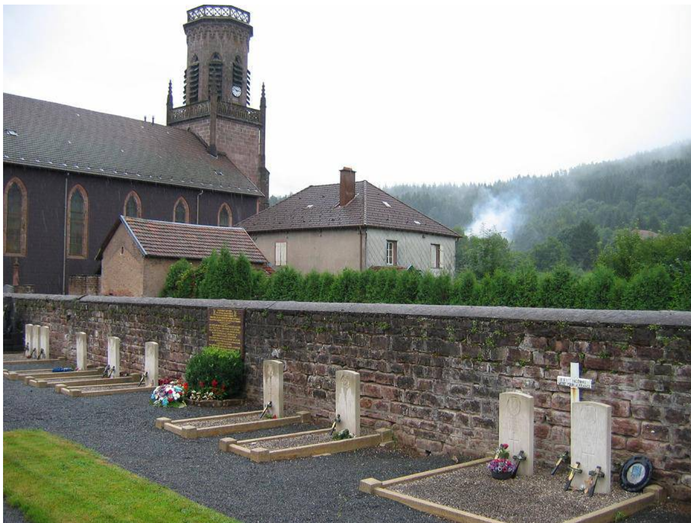
Cimetière de Moussey. Les Tombes de 10 des parachutistes Anglais exécutés