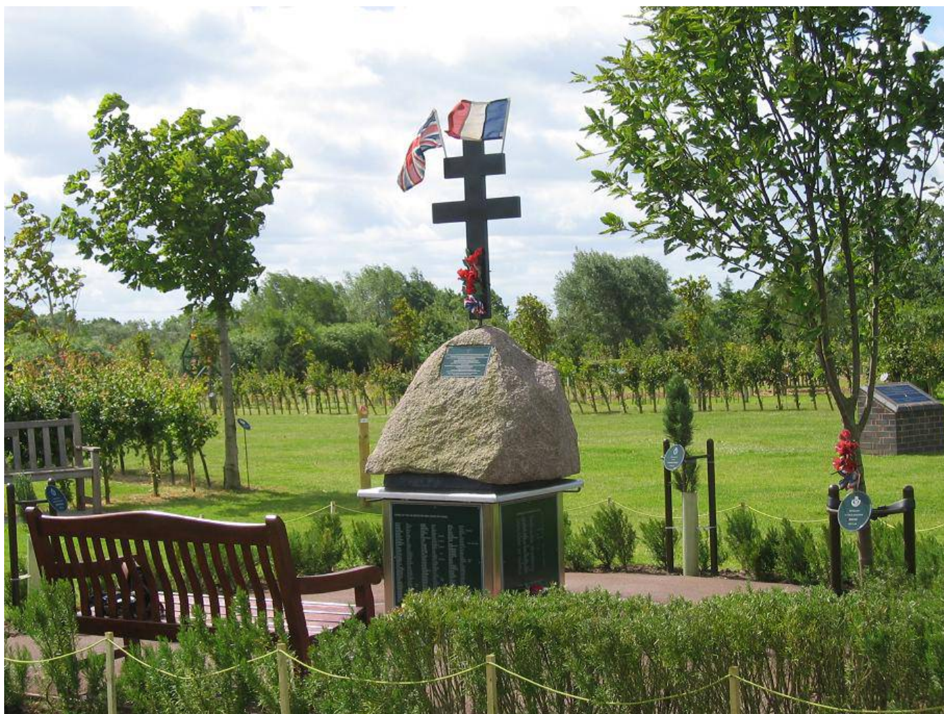
Le Phantom Memorial National Memorial Arboretum. Alrewas. Angleterre

Commun hommage aux parachutistes Anglais et résistants du Rabodeau