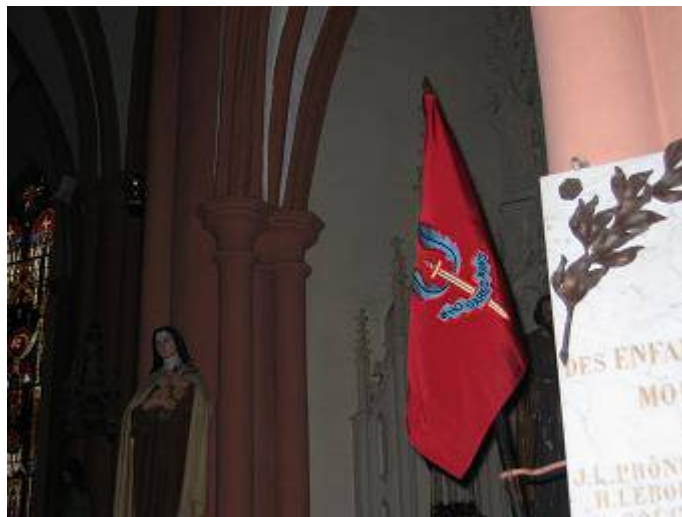
Eglise de Moussey. Le fanion du 2ème SAS

C'est une leçon que nous ne devons pas oublier