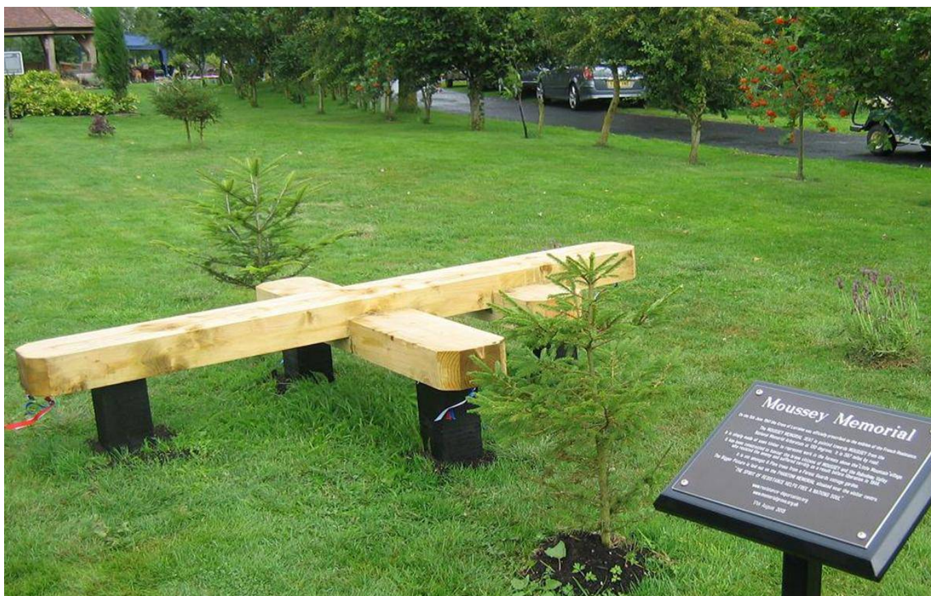
Le Moussey Memorial National Memorial Arboretum. Alrewas. Angleterre