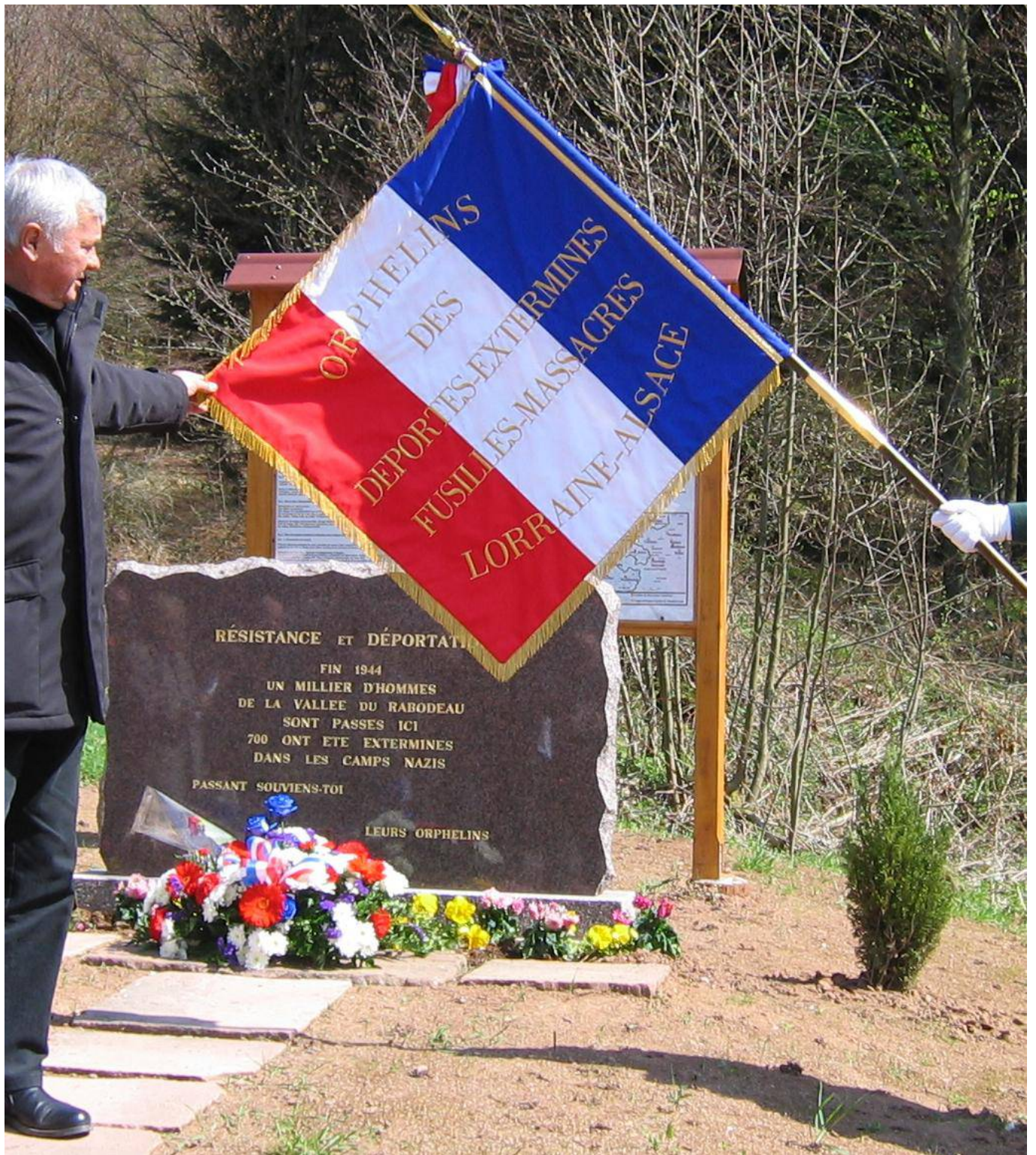
Stèle du col du Hantz (2004)